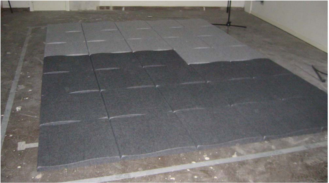
Wall paneelit asennettuna kaiuntahuoneen lattialle.

Näyte asennettiin kaiuntahuoneen lattialle ilman rakoja. Kappaleet asennettiin siten että yksittäinen rivi aina muodosti aaltokuvion. Näytteen asennuksessa noudatettiin standardin ISO 354:2003 liitteen B ohjeita.